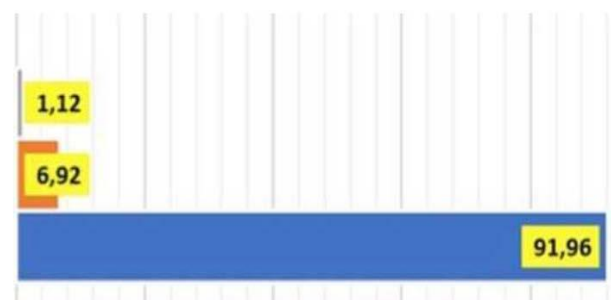
Tanggapan Item "Evaluasi" PAI Monev Pembelajaran IAIN Purwokerto 2020